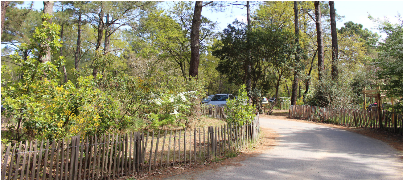
● Grande promenade reliant l'entrée du site au village de cabanes

Les différentes phases du chantier vont s'échelonner et seront ponctuées d'interruptions lors des périodes de vacances scolaires afin de garantir au public les meilleures conditions de visite. Pour la sécurité de chacun, certaines zones de l'espace d'accueil sont ou seront, pour un temps donné, interdites au public. Elles sont balisées par une signalétique d'orientation et d'information qui évoluera au fur et à mesure de l'avancée des travaux.