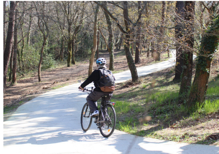
● Piste cyclable en entrée de site