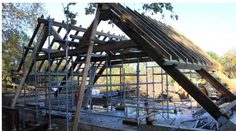
● Reconstruction à l'identique de la cabane dédiée à la médiation environnementale