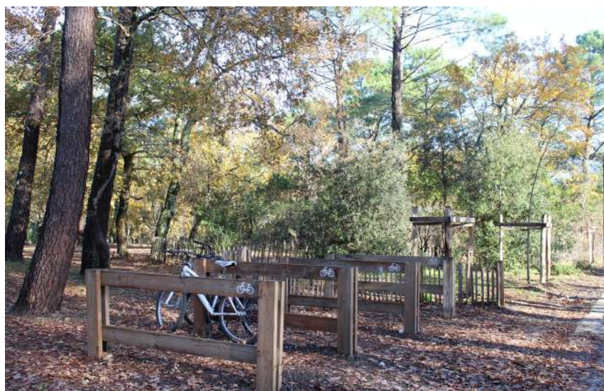
● Racks à vélo le long de la grande promenade

Les visiteurs accédant par les transports en commun ou à vélo utilisent la « grande promenade » qui leur permet de se diriger vers le pied de Dune à l'abri des autres flux de circulation et de débiter ainsi leur immersion dans le Grand Site. La placette en bois, située à mi-parcours de la grande promenade , où convergent les flux piétonniers émanant des zones de stationnement, a été réalisée à la fin de l'année 2022.