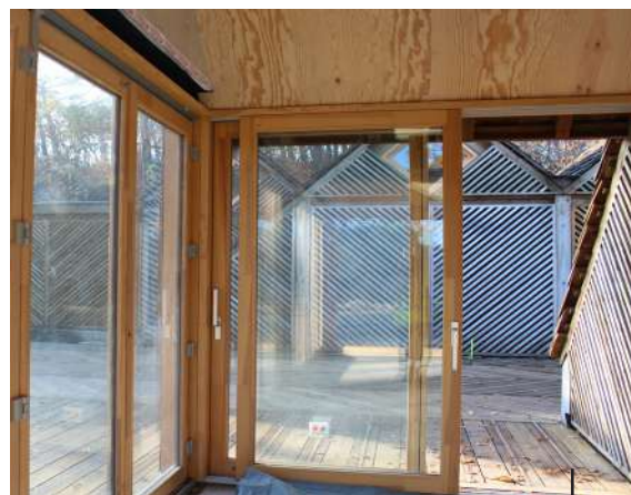
● Agencement intérieur de la cabane information