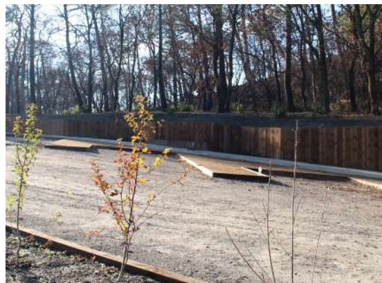
● Places de stationnement des bus et plantations

S'agissant de l'accueil des bus, les 8 places de stationnement dédiées ainsi que les quais en platelage bois et adaptés aux personnes à mobilité réduite sont réalisés et opérationnels depuis octobre dernier.