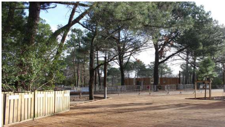
● Placette en bois, à mi-parcours de la grande promenade